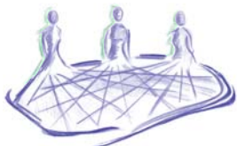
ARABAKO BASERRITAR, INQUIRUKO EHAKUHEEN SAREA RED DE MUJERES DEL MEDIO RURAL DE ÁLAVA

RED DE MUJERES DEL MEDIO RURAL DE ÁLAVA Sala de concejo s/nº 01475 Menagaray (Álava) Tfno.: 945 399 354 www.muieresruralesalavesas.org